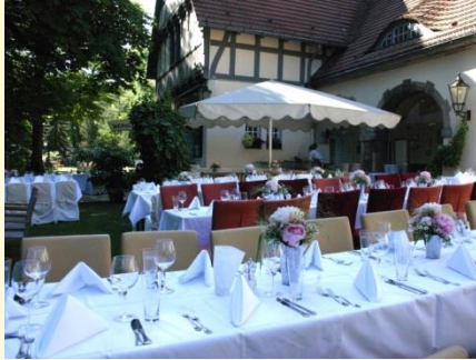
Feiern Sie zum Beispiel in der Schmugglerscheune