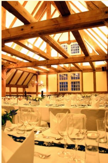
Feiern Sie zum Beispiel in der Schmugglerscheune