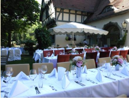
Feiern Sie zum Beispiel in der Schmugglerscheune